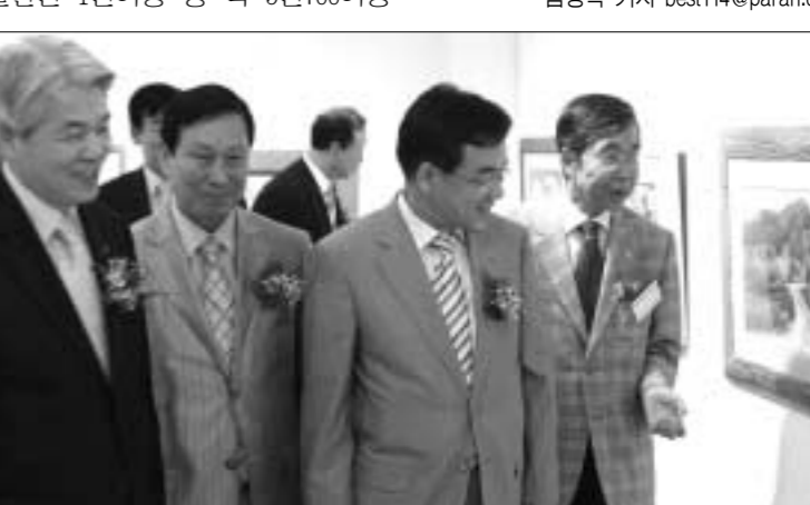
경기도교육청(교육감 김진춘)은 지난 8월2일부터 8월7일까지 수원미술관에서 주최한 제12회 경기도교원미술작품 전시회를 개최하고 8월7일 막을 내렸다.

이 관람했다. 이번 전시회는 학생들에게 방학을 이용한 선생님들의 예술혼을 감상할 수 있는 기회와 더불어 미술과목의 수행평가과제를 수행할 수 있는 좋은 기회라는 평가를 받았다. 경기도교육청은 이번 전시회가 성원화, 한국화, 판화, 디자인, 공예, 서예 등 미술의 모든 분야를 한눈에 볼 수 있는 행사였고 선생님들이 차곡차곡 쌓아온 삶의 자취가 고스란히 예술의 향기로 피어난 작품을 볼 수 있는 자리와 더불어 가족의 정취와 함께 참신한 흥미를 만들 수 있는 알찬 전시회였다고 밝혔다. 김영복 기자 best114@paran.com