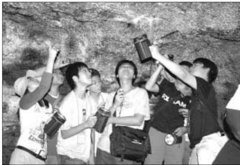
포천시 내촌면 신팔리 356-1번지에 문을 연 곤충테마여행은 곤충농장으로 곤충사육 및 판매를 하고 있으며 체험학습장으로 단체견학을 실시하고 있다.

경기도과학교육원 부설 영재교육원(원장 이민구)은 영재교육대상학생 56명(고1)을 대상으로 지난 7월 25일부터 7월28일까지 제주도 일대에서 하계 영재캠프를 실시하고 8월1일 과학교육원 세미나실에서 탐구결과 발표회를 가졌다. 이와 과학 체험 활동을 통하여 창의적인 사고와 합리적인 과학태도의 신장이라는 목적으로 실시된 이번 현장탐구학습은 고등학교 1학년 과학영재학생에 적합한 프로그램을 선정하고 테마별 탐구과제를 제시했다. 테마별 탐구과제는 제주도의 지질과 용암동굴(대십이굴)의 생성과정 탐사, 동백동산의 식물상과 멸종위기 야생식물 탐구, 제주도 꽃자갈 식물 및 식생 연구, 제주 곤