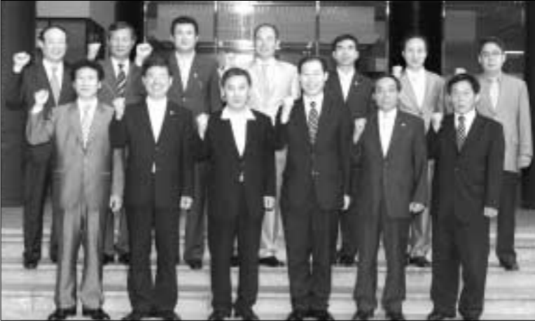
지난 2003년부터 자매결연 관계를 맺고 있는 경기도 포천시와 서울시 노원구가 최근 상호 교류협력 강화를 위한 간담회를 개최했다.