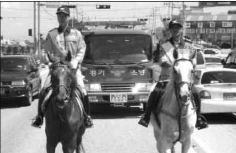
포천소방서는 시민참여 자율안전문화 의식을 함양하고 소방의 이미지 제고를 위해 마필을 보유한 자원봉사자를 활용한 '119 기마순찰대'를 운영한다.