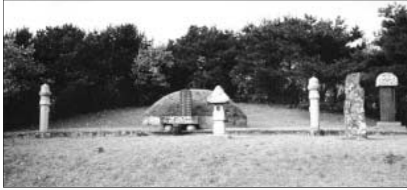
소흘읍 이곡리에 위치한 심통원 선생 묘

· 지정번호: 향토유적 제16호 · 소재지: 소흘읍 이곡리 · 건립연대: 1575(선조 8년) · 규모: 총고 343cm, 비고 180cm, 두께 32cm · 비고: 심진 찬(撰)· 심극명 서(書)· 심방전(篆)