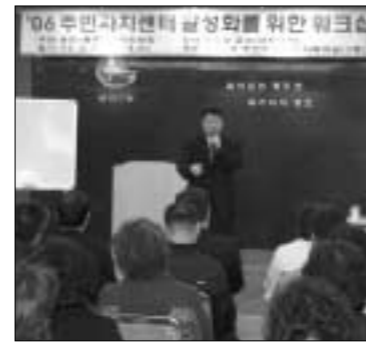
생연1동 주민자치위원회는 지난 21일 주민자치센터 활성화를 위한 주민자치위원의 역할이라는 주제로 워크숍을 실시했다.

또한 생연1동 자치위원회는 '05년도 자치센터 평가결과 최우수로 받은 상금과 바자회 등을 통해 마련한 기금으로, 관내 고등학생 중 어려운 가정 환경에도 열심히 공부하여 학업성적이 우수하고 모범적인 학생 3명을 선발, 장학금(1인당, 30만원)을 전달하고 용기와 희망을 갖고 열심히 공부하여 이 나라의