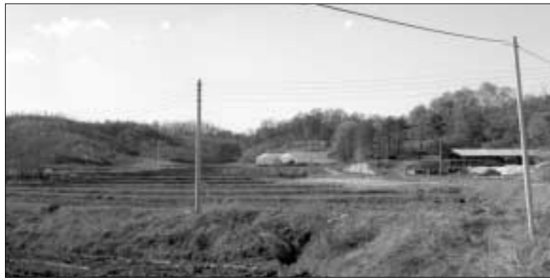
양주시는 관리지역 전역과 도시지역외 지역에 대한 개발행위 제한을 변경한다고 고시했다.

양주시는 지난해 11월 24일 고시한 관리지역 전역과 도시지역외 지역 등에 대한 개발행위 제한을 변경한다고 고시를 통해 밝혔다.