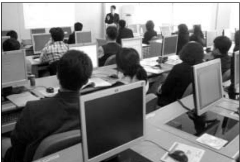
연천군은 지난 28일 전산교육장에서 실과별 복식부기 담당, 사업소 및 읍·면 복식부기 담당자 2개반 41명에 대한 시스템 구축사업체의 전문 강사를 초빙 복식부기 전산시스템 교육을 실시했다.

연천군은 지난 23일 전산교육장에서 실과별 복식부기 담당, 사업소 및 읍·면 복식부기 담당자 2개반 41명에 대한 시스템 구축사업체의 전문 강사를 초빙 복식부기 전산시스템 교육을 실시했다.