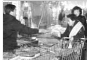
동두천시 여성단체협의회는 지난 23일 오후 동두천 중앙시장에서 설날을 맞이하여 설 성수품은 재래시장에서 구입하고 내고장 상품 팔아주기 및 물가안정을 위한 캠페인을 실시했다.