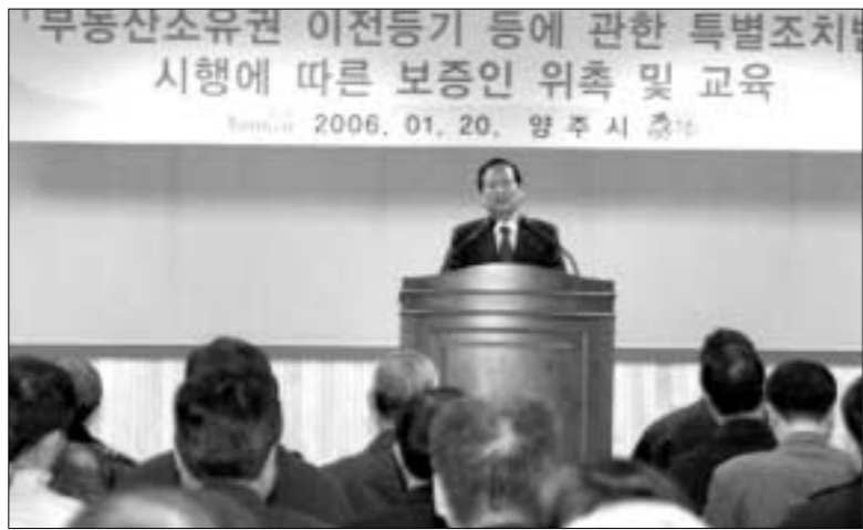
양주시는 지난 20일 양주시청 대회의실에서 보증인 및 담당자 등 170명을 대상으로 '부동산소유권 이전등기 등에 관한 특별조치법' 입법취지 교육을 실시했다.

일 현재 토지·임야대상 및 건축물 대장에 등록된 토지 및 건물 가운데 1995년 6월 30일 이전에 매매와 증여·교환 등 법률행위와 상속으로 인하여 사실상 양도된 부동산이며, 적용지역 및 대상은 읍·면지역