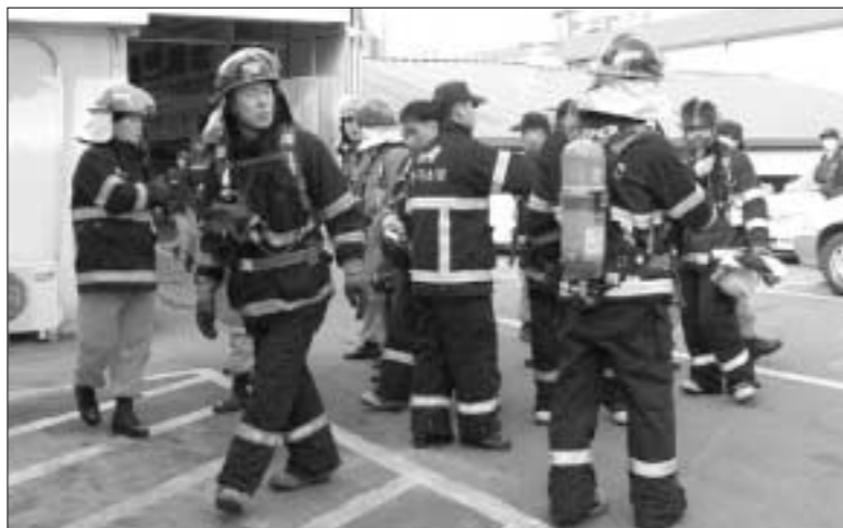
의정부소방서는 지난 20일 의정부시 제일시장에서 유관기관 44명의 인원과 17대의 소방차량 등이 동원된 가운데 1월 유관기관 합동 소방훈련을 실시했다.