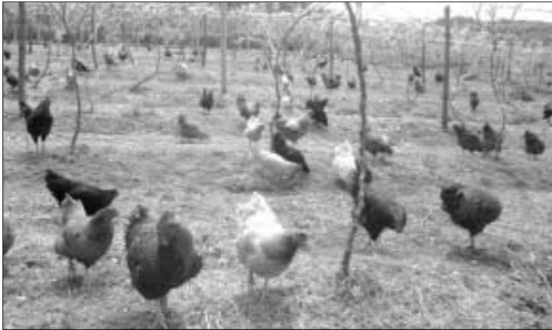
경기도는 환경친화적인 축산조성과 예방위주의 가축방역 강화, 그리고 소비자 지향의 안전축산물 생산공급을 위하여 843억원을 투입한다고 밝혔다.

한우명품화, 우수브랜드육성, 광역 브랜드 조성 등 축산물 고급화시책에 172억원을 투입할 계획이다.