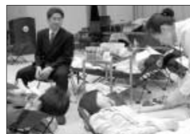
2006년도 상반기 공직자 사랑의 헌혈 행사에 지난 19일 의정부시청 대강당에서 실시했다.