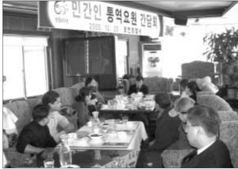
포천경찰서는 구립 20일 민간인 통역요원 및 외국인근로자 범죄피해 신고센터를 활성화하기 위한 민간인 통역요원 간담회를 개최했다.