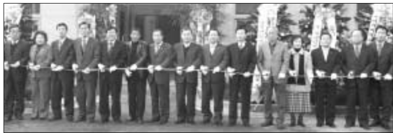
광릉숲 자연생태계 보존에 기여하게 될 포천시 직동하수처리장이 구립 29일 준공됐다.