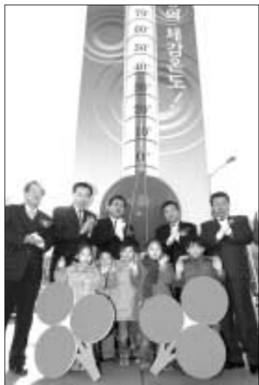
지난 2일 사랑의 체감온도탑 제막식에서 순화규 경기도지사 등 내빈들이 제막을 마친 후 어린이들과 기념사진을 찍었다.

경기도 사회복지공동모금회는 지난 2일 도청사거리에서 순화규 도지사, 유영욱 경기도의회 의장, 김진춘 경기도교육감 등이 참석한 가운데 '사랑의 체감 온도탑' 제막식을 가졌다. 공동모금회는 '나누면, 행복+행복'이라는 슬로건을 앞세워 연말연시 집중모금기간 동안 모금 목표액을 64억원으로 설정, 62일간의 대장정을 펼치게 된다. 특히, 도청사거리에 설치된 사랑의 체감 온도탑은 6천4백만원이 모일때마다 1도씩 사랑의 온도가 올라가도록 하여, 뜨거운 이웃사랑을 직접 눈으로 확인할 수 있도록 했다. 모금회는 희망2006이웃사랑캠페인 연말연시 집중모금액 64억원을 포함해 2006년 한해 총 123억의 이