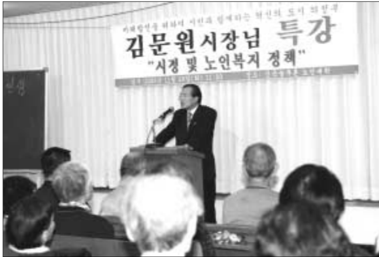
신곡2동 늘푸른노인대학 특강 김문원 의정부시장은 지난달 29일 신곡2동 늘푸른노인대학에 참석, 특강을 통하여 21C 고령화시대를 대비 어른들을 위한 다양한 문화복지시설을 운영해야 한다고 밝혔다.

새로운 창조를 위한 역발상 워크숍 개최 의정부시는 "위"로 부터가 아닌 스스로 "하위"로 되돌아오는 의식 변화를 위한 새로운 모티브를 만들기 위해 지난달 29일 대강당에서 "일 못하고 짜증나는 의정부 만들기" 워크숍을 개최했다. 부서별 혁신전사와 혁신토론 소모임인 '주니어보드' 팀원들 6개 분임조 88명이 참여한 이번 워크숍은 ▶일거리 늘리는 방법 ▶나랏돈 평평 쓰는 방법 ▶부하 직원에게 욕먹는 방법 ▶민원인 열 받게 하는 방법 ▶상사에게 찍히는 방법 ▶풍류에게 왕따 당하는 방법 등 6개 과제를 하나씩 선택하여 분임별로 토론을 진행했다. 시는 혁신의 열쇠인 '역발상'을 통해 2006년 행정혁신 추진방향을 모색하고 직원들의 독창적인 아이디어와 적극적인 자세로 시민에게 기쁨 주는 의정부시 공직자상이 새롭게 정립되는 계기가 되기를 기대한다고 밝혔다. 지혁배 기자 94spice@hanmail.net