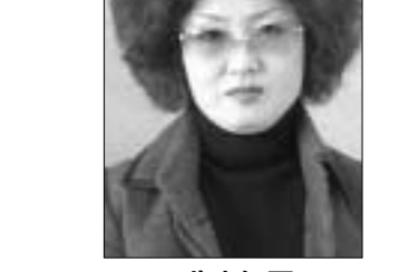
백복금 솔모두문학회 편집위원

안타까운 그의 가슴에서 가난하였으므로 더욱 뜨거웠을 사랑을 만난다 그 맘에 내 맘이 닿아 허물한 주막집 쓸쓸한 나무의자에 앉아 소주를 마신다 애달픈 사랑도 잊어아할 그대도 테러 당한 내 심장도 비워지는 잔 만큼씩 텅텅빈 진다 필월 눈이 내린다 시란 별 총총한 하늘을 이고 지독한 그리움 하나 비를대며 걸어나간다