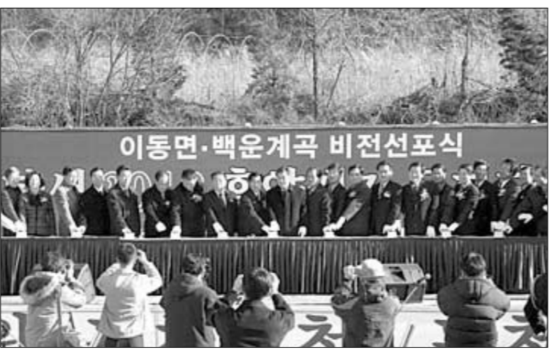
제2회 백운계곡 동장군 축제가 겨울날만 1번지, 포천시 이동면 도평리 백운계곡 국민관광지 입구 일원에서 오는 24일부터 내달 29일까지 펼쳐진다. 사진은 지난해 개최된 제1회 백운계곡 동장군 축제 비전선포식.