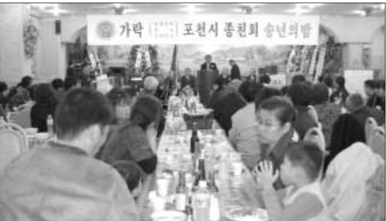
가락 김해김씨 포천시종친회