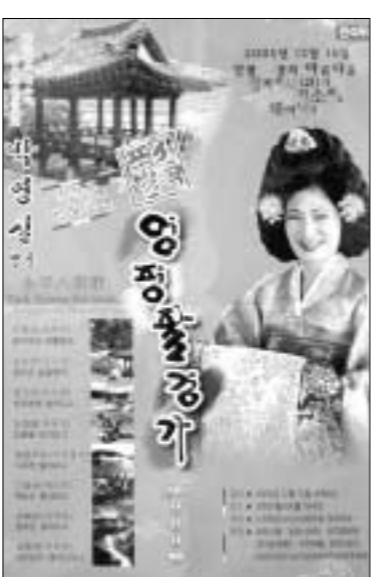
(사)경기소리보존회 포천지부는 오는 15일 오후 4시부터 반월아트홀 대극장에서 포천별곡 영평팔경가 창작곡 발표무대를 마련한다.

영평팔경가는 ▶서곡 화적에서 버를 털어 ▶1경 선유담 ▶2경 와룡암 ▶3경 백로주 ▶4경 낙귀정지