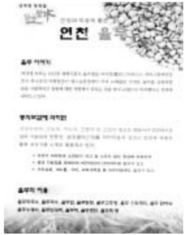
연천군 농업기술센터가 군 주요 특산물인 율무의 소비촉진과 율무 효능의 홍보를 위해 제작한 율무 홍보액자.

연천군 농업기술센터(소장 이상호)는 군 주요 특산물인 율무의 소비촉진과 율무 효능의 홍보를 위해 지난 23일부터 30일까지 관내 율무 음식점 11개소에 대해 율무 홍보액자 25개를 제작 배부했다.