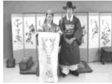
덕계고는 경기도 교육청의 지원으로 17개의 예절실을 운영하고 있다.

덕계고 예절실이 주목을 받는 이유는 그 동안 형식적인 이론교육에서 탈피하여 학생들이 몸소 체험할 수 있는 실습의 장을 마련했다는 데 있다. 예절실은 교실 한 칸 크