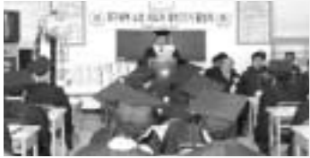
경기북부노인지도자대학은 지난 23일 노인대학 3층 강당에서 2005년도 제22기 경기북부노인지도자대학 수료식을 개최했다.

경기북부노인지도자대학은 지난23일 오전11시 노인대학 3층 강당에서 최용수 동두천시장을 등 100여명이 참여한 가운데 2005년도 제22기 경기북부노인지도자대학 수료식을 개최했다. 이번 수료식에는 총58명(남 13, 여45)이 수료했다. 경기북부노인지도자대학 총1,331명의 졸업생을 배출했다. 지혜배 기자 94spice@hanmail.net