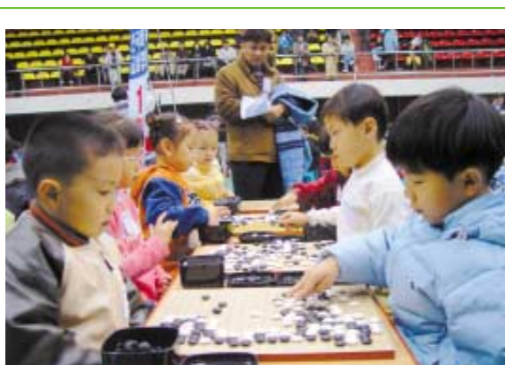
지난해 개최된 제2회 오성과 한음배 전국비독대회에 참가한 어린이부 학생들이 자용을 겨루고 있다.