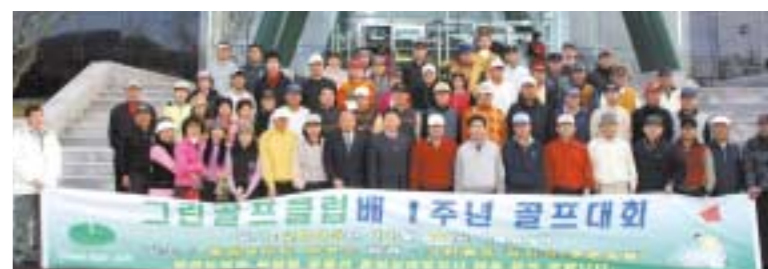
지난 14일 영북면 몽베르C.C.에서 개최된 '그린골프클럽배 1주년 골프대회'에 참가한 회원들이 대회의 성공을 기원하며 기념촬영을 했다.