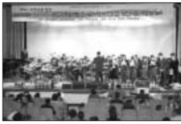
연천문화원은 지난달 29일 연천 군민회관에서 학교·지역사회 연계 문화예술교육 작품 발표회를 개최했다.

작품발표회는 지역 내의 문화예술기관·단체와 연계협력 시범사업을 통해 실효성 있는 지역별 문화예술교육 프로그램 모델 개발과 확산을 도모하고 문화예술 현장과 연계된 다양한 교육프로그램을 개발, 제공함으로써 학생들의 문화감수성 및 창의력의 토대를 마련하기 위해 추진되었다.