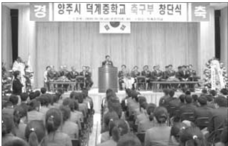
지난달 28일 덕계중학교에서는 임종빈 양주시장 정성호 국회의원 등 200여명이 참석한 가운데 축구부 창단식이 마련됐다.