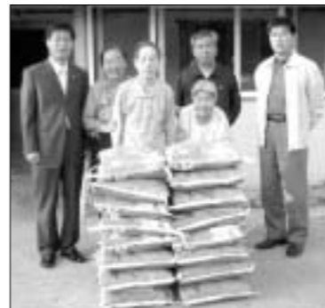
농업기반공사 연천·포천지사는 최근 쌀값 하락으로 어려움을 겪고 있는 농민들을 위해 전직원이 동참하여 가운데 1직원 10kg 우리 지역 쌀 사주기 운동을 실시했다.

한편, 관내 쌀전업농 단체로부터 구입한 쌀 20여 포대(320kg) 전량 임차하여 불우이웃에게는 작은 희망을 주고, 불우한 이웃과 따뜻한 온정을 함께 나눌 수 있는 소중한 계기가 되었다고 말하며, 앞으로도 이웃들에게 농촌의 어려움을 적극 알리며 우리 지역 쌀 사주기 운동에 적극 동참해 나갈 방침이라고 밝혔다.