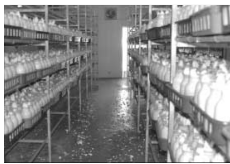
대성농산에서 생산한 버섯은 홀플라나 웰마트, 백화점 등에 전량 출하하고 있다. 새송이버섯은 노화방지와 항암효과도 있어 소비자들에게 애호되고 있다. (사진은 컨테이너 재배사 전경)