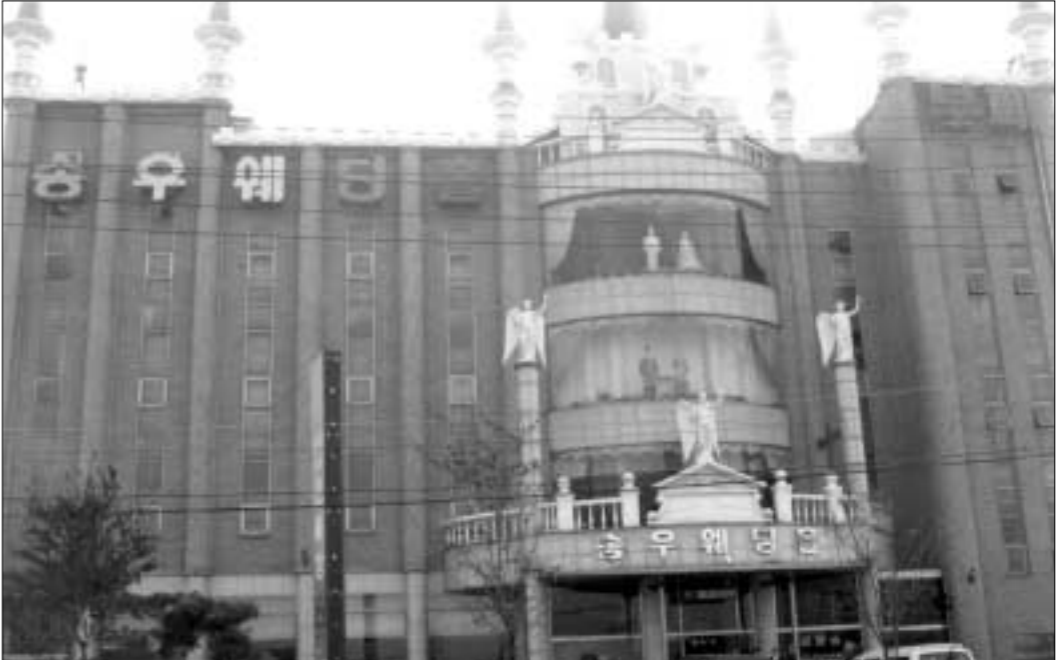
새로운 출발을 약속하는 신랑신부의 소중한 예식행사는 물론 가족행사, 기업세미나 등 특별한 행사 공간을 제공하고 있는 송우웨딩홀.

다. 송우웨딩홀은 이 밖에도 백일, 돌, 회갑, 고회연 등에 적합한 장소이며 정식뷔페, 갈비탕 뷔페, 국수 뷔페 등 다양하면서도 저렴한 가격대의 식단을 제공하며 모든 고객을 맞이하고 있다. 또한 50인 이상 모임이나 회식자리에는 출장뷔페가 가능하며 송우웨딩홀만의 양질의 음식을 제공할 수 있는 기회도 주어진다. 송우웨딩홀은 양대 명절을 제외하고 연중무휴, 영업시간은 오전 9시부터 오후 8시까지 운영하고 있으며 고객편의를 위해 2대의 15인 승 차량을 운영하고 있다. 또한 이 대표는 지속적인 경영혁신으로 고객들의 욕구충족을 위한 경영에 최선을 다할 것을 약속하고 있다. 현재 이 대표는 동남고등학교 총동문회장과 갈일중학교 운영위원, 소흘지구대 생활안전협의회 위원으로 지역사회 발전을 위해 활동하고 있다. 예약 문의 031)541-2244-5 정병갑 기자 jpk61@paran.com