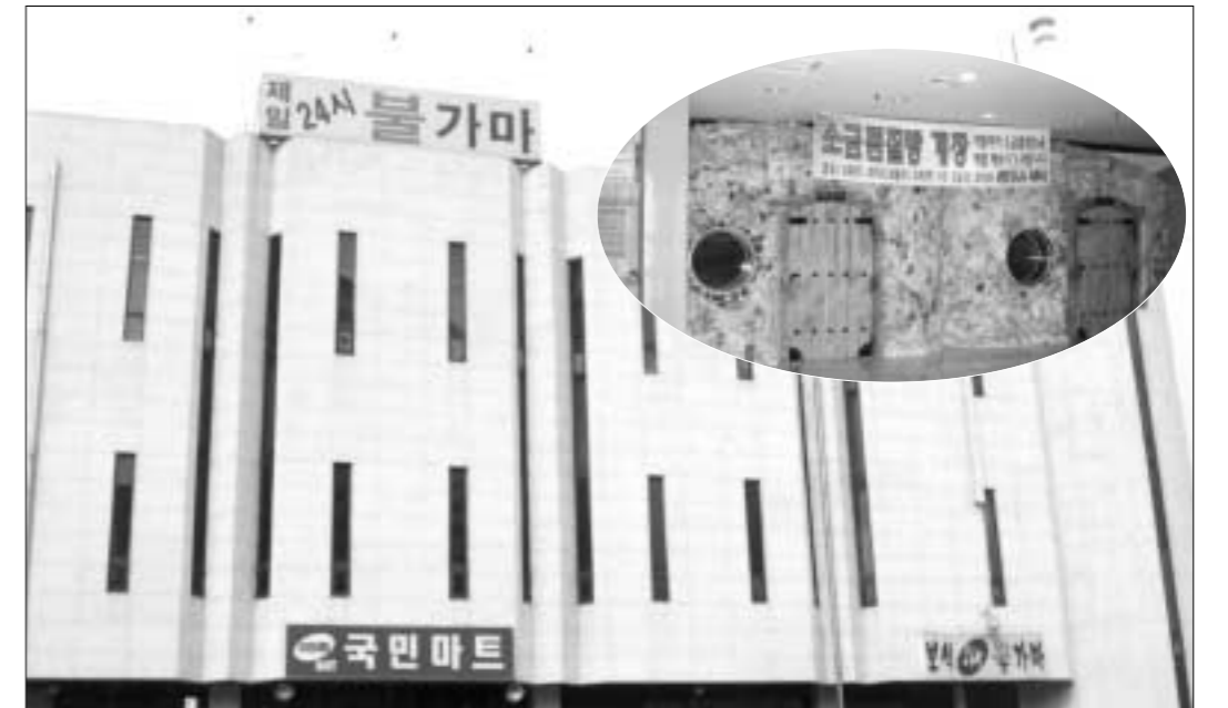
제일24시간불가마사우나는 지난 1995년 개장해 11년째 인근고객들의 사랑을 받으며 고객과 함께 성장해온 지역의 대표 사우나탕이다.