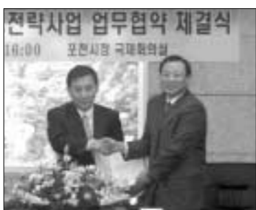
지난 25일 포천시청 국제회의실에서 인천·경기가구공업협동조합과 업무협약 체결식을 가졌다.

포천시가 가구산업 특화전략사업을 적극 추진키로 하고 인천·경기가구공업협동조합과 업무협약 체결식을 지난 25일 포천시청 국제회의실에서 가졌다.