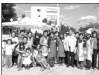
지난 15일 소흘읍 이동교리 한빛전원교회에서 교회창립 16주년 행사의 일환으로 창립기념 불우이웃돕기 바자회를 주최했다.