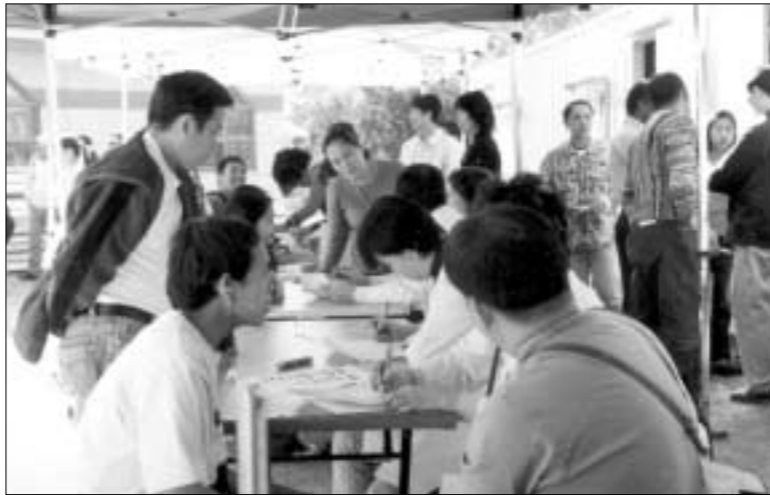
제3회 외국인 근로자 한가족 잔치에 250여명이 참석해 건강검진 및 점심식사, 노래자랑 등을 하면서 즐거운 시간을 보냈다.

이번 행사에서 포천병원은 가정의학과를 비롯한 신경과, 산부인과, 외과, 진단검사의학과 검사, 체열