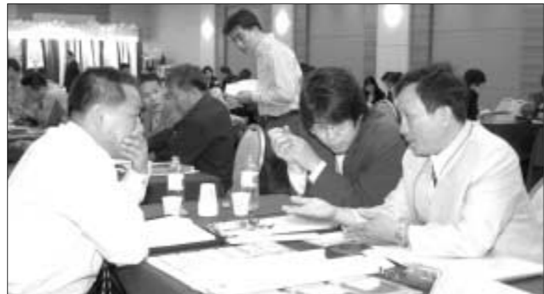
포천시가 지난 9일부터 7일까지 신북면(주)아도니스 호텔에서 개최한 2005 포천국제무역상담회에서 1억 3천만달러 이상의 상담이 이루어졌다.