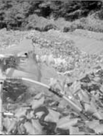
포천시 소흘읍 이동교리에서 무란포도농원을 경영하는 최병혁 대표는 병충해 방지를 위해 개량비가림 방식으로 포도를 재배한다.

“후회는 없고 건강하게 살자”를 생활신조로 살아온 최 대표는 1남1녀를 두고 있으며 조금만 생각을 바꾸면 일할 수 있는 여건이 조성돼 있다며 앞으로도 다양한 노력을 기울이지 않겠다고