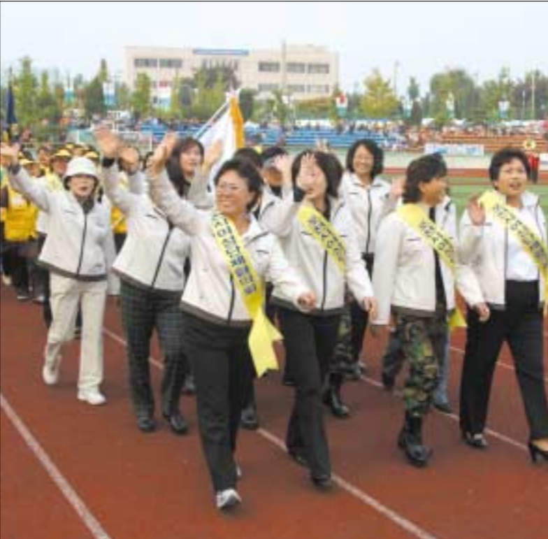
▲제3회 포천시민의 날을 맞아 포천시 여성단체협의회 각 회장들이 입장식에 참여하고 있다.(그 뒤로 여성단체협의회 회원들이 함께 입장하고 있다.)