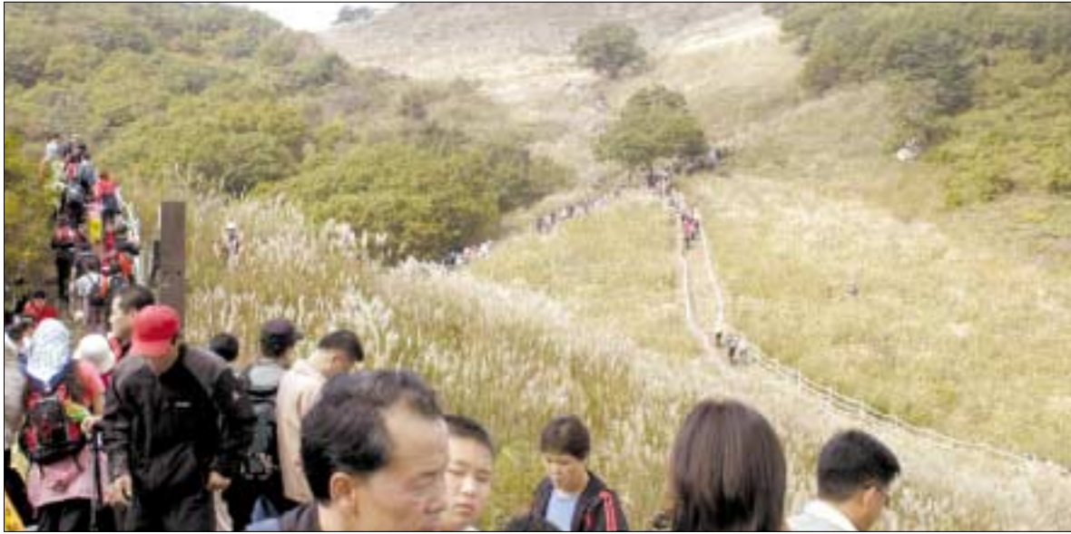
‘자연과 사람의 어울림’이라는 주제로 개최된 제9회 산정호수 명성산 억새꽃 축제에 관광객 10만여명이 몰렸다.

‘자연과 사람의 어울림’이라는 주제로 개최된 제9회 산정호수 명성산 억새꽃 축제에 관광객 10만여 명이 몰려 성공한 지역축제로 자리매김했다는 평가를 받고 있다. 8일과 9일 산정호수 상동 주차장과 명성산에서 개최된 이번 명성산 억새꽃 축제는 산정호수 주민들과 포천시봉산단체가 자발적으로 참여해 민간주도 축제로 발전하는 양상을 보여줬다.