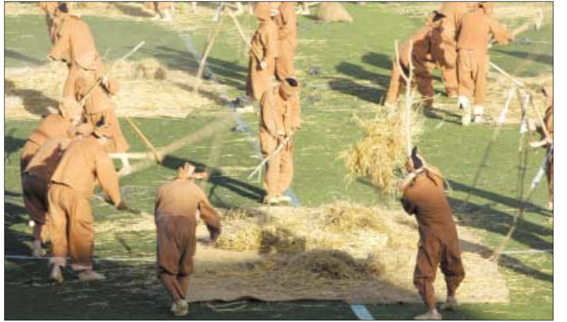
제46회 한국민속예술 축제는 제주도 하귀리 민속보존회의 귀리걸보리 농사일소리가 대통령상 수상해 상금으로 1천만원을 수여받는 것을 끝으로 대단원 막을 내렸다.

또한 그동안 포천시 주도로 치러왔던 억새꽃 축제를 공무원보다는 산정호수 관리지부를 비롯한 아마추어 무산연맹 포천사무소, 모범운전자회, 해병전우회 등이 적극적으로 참여해 산정호수 억새꽃 축제가 민간주도형 지역축제로 자리를 잡았다는 점이 이번 축제의 큰 성과라고 할 수 있다. <관련기사 16면>