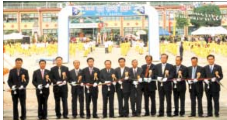
지난 8일 청성초등학교 개교 70주년을 맞아 총동문회 기금으로 개축한 교문커튼식을 가졌다.