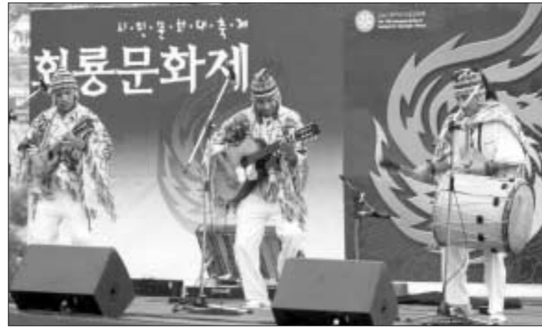
올해 성년을 맞는 의정부시 대표적인 축제 회룡문화제가 다음달 3일 경기도 제2청사 앞에서 개막식을 시작으로 8일까지 다채롭게 펼쳐진다. 사진은 지난해 개최된 제19회 회룡문화제 행사 모습.

올해 성년을 맞는 의정부시 대표 축제 회룡문화제가 다음달 3일 경기도 제2청사 앞에서 개막식을 시작으로 8일까지 다채롭게 펼쳐진다.