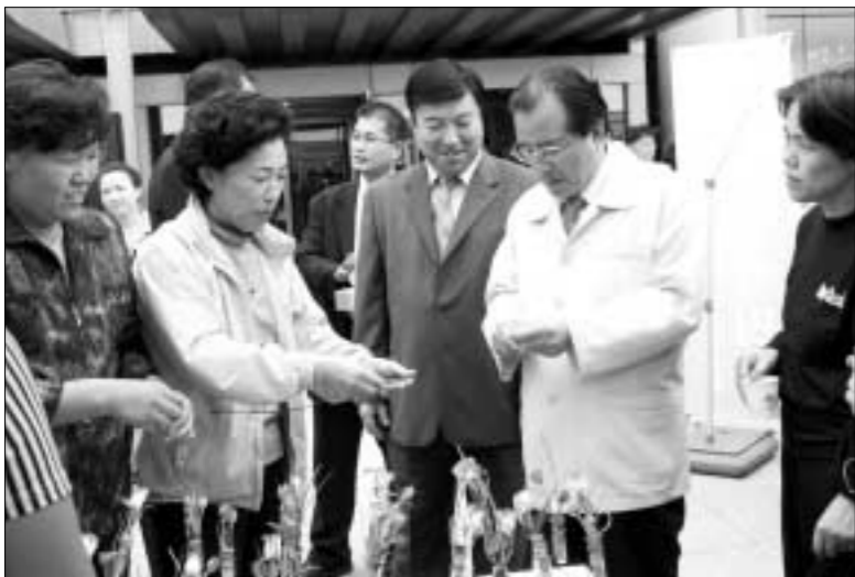
의정부시에서는 22일부터 23일까지 의정부예술의 전당에서 15개 동 1천500여명이 참여하는 제1회 주민자치센터 작품전시 및 발표회를 개최했다.