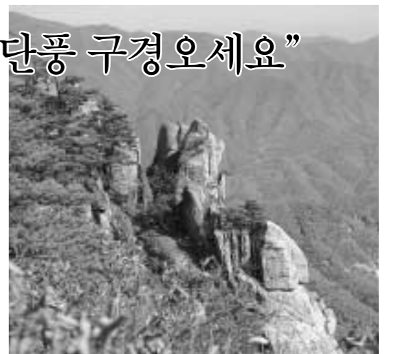
아름다운 가을단풍으로 명성이 높은 화현면 운악산에서 등산대회와 공연, 전시회가 어우러진 단풍축제가 내달 15일과 16일 이틀간 개최된다. 사진은 가을 단풍이 물든 운악산 전경.