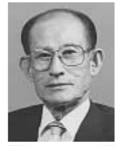
리효중 포천한시사 대표

남명조식(南冥 曹植)·1501(연산군7)~ 1572(선조5) 본관은 창령 지는 건중 호는 남명이며 지평 언현의 아들이다. 1501년(연산군7) 경성좌도 예안(경북 안동)에서 퇴계 이황이 태어나고 경성우도(경북 합천)에서는 남명 조식이 태어났다. 16세기 기호학과, 영남학과 형성기에 두 선비는 영남학파의 두 거봉으로 같은 해 태어났다. 퇴계가 경성좌도 영수라면 남명은 경성우도 영수이다.