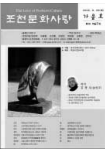
포천문화원이 발행한 포천문화사랑 가을호(총권 제6호).