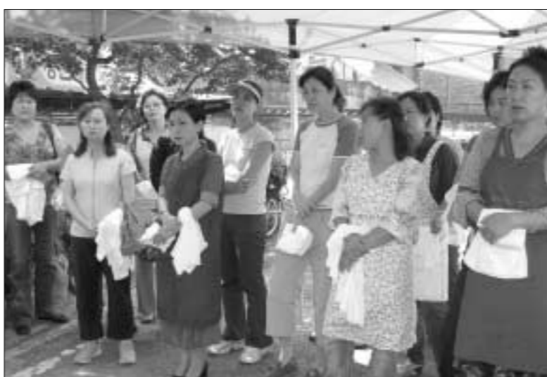
포천동은 지난 26일 동사무소 광장에서 30여명의 청소년 및 학부모가 참여한 가운데 천연염색 체험 프로그램을 마련했다.