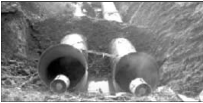
농업기반공사 40억원을 발행하고, 국비 10억원을 추가 확보한 가운데 왕산지구 농업용수 개발사업이 조기준공을 앞두고 있다.