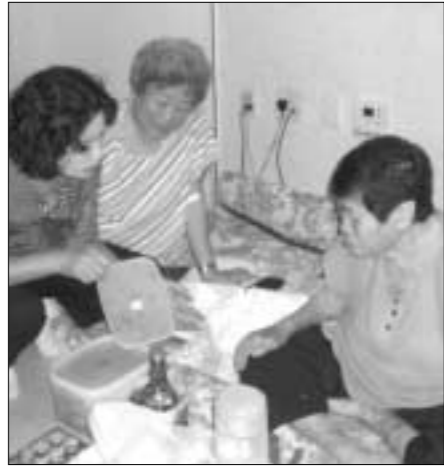
동두천시 상패동 남·여 새마을지도자협의회 회원들이 지난달 30일 밀반찬을 독거노인에게 전달하고 있다.

상패동 남·여 새마을지도자협의회는 매달 한차례 모여 밀반찬을 만들어 어려운 이웃에게 계속적으로 전달할 예정이라고 밝혔다.