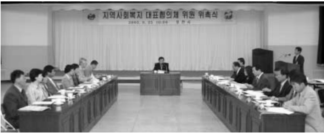
지난 26일 시청 3층 대회의실에서 지역사회복지 대표협의체 위원 등 관계자 20여명이 참석한 가운데 지역사회복지 대표협의체 위원 위촉식이 마련됐다.

포천시는 지역사회복지 대표협의체 위원 위촉식으로 사회복지정책 수립과 추진 등 종합 복지서비스를 위한 본격적인 활동에 돌입했다.