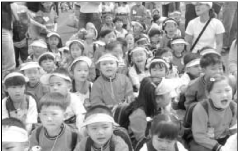
포천시는 2005년 1월 1일 이후에 태어나는 둘째 이후 신생아 전원을 대상으로, 둘째 아기에겐 20만원을, 셋째 아기부터는 40만원을 신생아 출산장려 축하금으로 지원하고 있다.