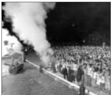
제7회 동두천 락 페스티벌이 공연이 지난 20일 부터 21일까지 동두천종합운동장 보조구장 특설무대에서 전국의 락 메니아 1만여명이 참여한 가운데 성황리에 개최됐다.

한 여름 밤을 뜨겁게 달군 제7회 동두천 락 페스티벌이 공연이 지난 20일부터 21일까지 동두천종합운동장 보조구장 특설무대에서 전국의 락 메니아 1만여명이 참여한 가운데 성황리에 개최됐다.