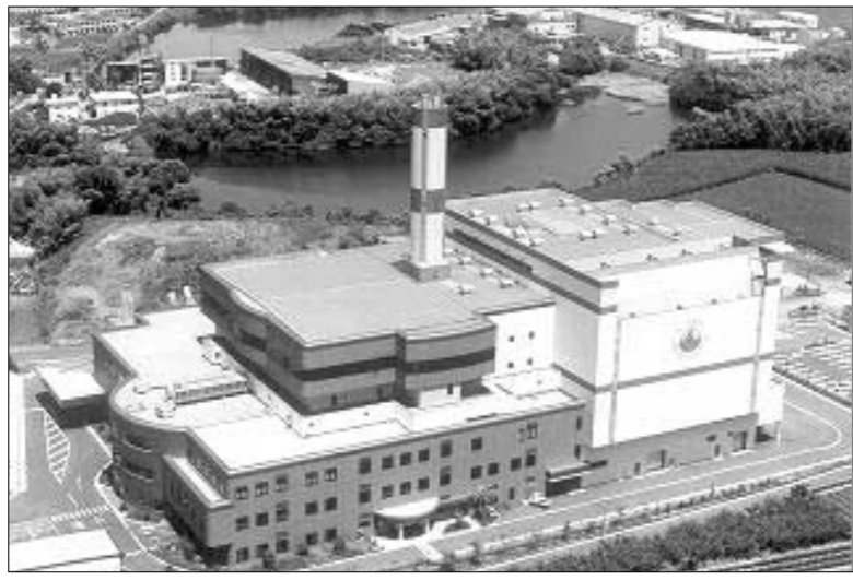
열분해용융방식의 최첨단 선진국형 소각시설을 추진하고 있는 양주권 광역자원회수시설 사업설명회가 지난 23일 양주시청 상황실에서 마련됐다.