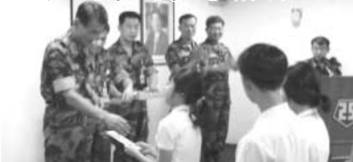
육군 제25사단 장교들이 지난 21년 동안 매월봉급에서 1천원씩을 모아 적전지역내 중·고등학교 학생들에게 장학금을 전달해와 화제가 되고 있다.(사진은 지난 14일 학생들에게 장학금을 전달하고 있는 제25사단 장교들)

육군 제25사단 장교들이 지난 21년간 남모르게 선행을 해오고 있어 지역 주민들의 화제가 되고 있다.