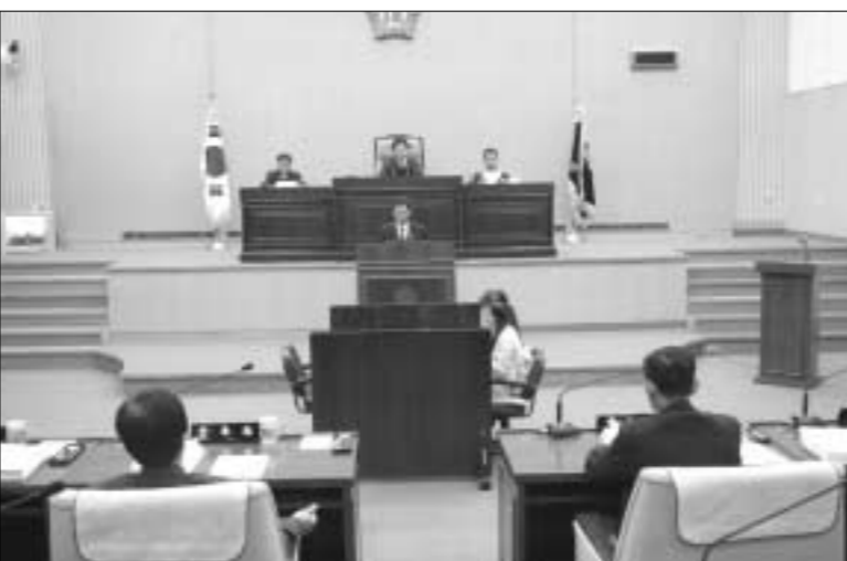
연천군의회는 지난 7일 본 회의실에서 김규배 연천군수, 실과원소장 및 방청객 등이 참석한 가운데 제132회 연천군의회 제1차 정례회를 개최했다.