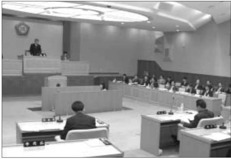
양주시의회는 제140회 정례회 마지막 날인 6일 옥정·광석지구 신도시개발계획에 대한 건의안과 국도3호선 대체우회도로공사 조기완공촉구 건의안을 채택했다.

옥정·광석지구를 판교급 신도시로 개발하겠다는 정부의 발표에 시민들은 새로운 희망의 도시에 대한 기대와 함께 염려를 갖고 있다며 교육과 문화 그리고 체육시설의 확보와 공업용지의 조성 등을 통해 자족 기능을 강화하여 신도시의 베드라