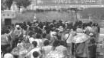
동두천시 여성단체협의회에서는 지난 4일 백일장 및 등산대회를 가졌다.