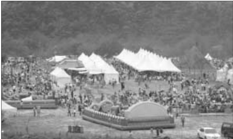
지난 5월 연천군 전곡리에서 개최된 구석기 축제 행사장에 많은 관광객이 찾아 축제를 즐겼다.

이와 더불어 "연천 전곡리 구석기 축제 또한 전국적인 축제로 발전할 충분한 잠재력을 가지고 있어 문화관광 대표축제로 추천했다"고 밝혔다. 지역해 기자 94spice@hanmail.net