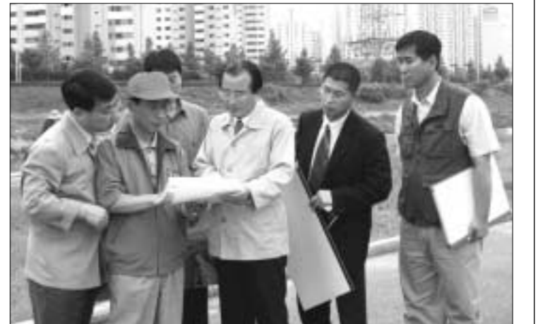
김문원 의정부시장은 7월7일 중랑천공원화 사업현장을 방문하여 관계자로부터 사업실명을 듣고 중랑천이 시민들의 건전한 여가생활과 인력향 휴식처가 될 수 있도록 최선을 다하여 줄 것을 당부했다.