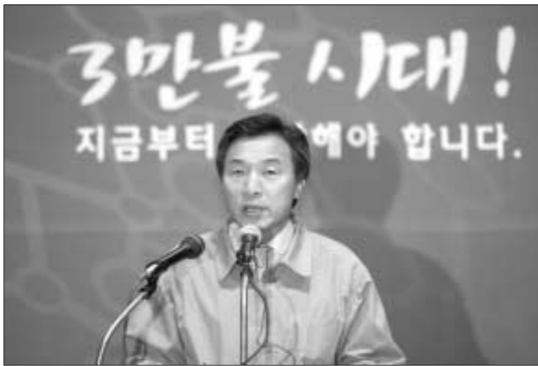
손학규 경기도지사는 지난 30일 오전 고양시 킨텍스에서 취임 3주년 기자회견을 갖고 경기북부에 북측 근로자가 근무하는 경제협력단지 '평화구역'의 조성을 구체화하여 정부와 북측에 제안할 계획과 일자리 100만개 창출 등 향후 도정 운영계획을 밝혔다.

또 손 지사는 국민소득 3만불은 단순한 수치가 아니라 21세기에 우리나라가 생존과 번영을 누리기 위한 필요조건이라고 밝히고 향후