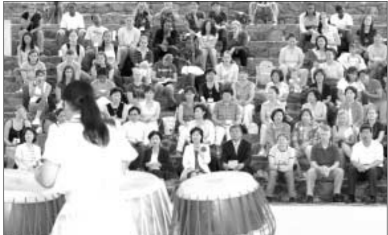
경기도 제2청은 지난 7일 미국, 일본, 필리핀 등 주한외국인 여성, 미2사단 소속 여군장병, 문화 교류에 관심 있는 내국인 등 280명이 참석한 가운데 양주별산대놀이마당에서 한마당 축제를 펼쳤다.