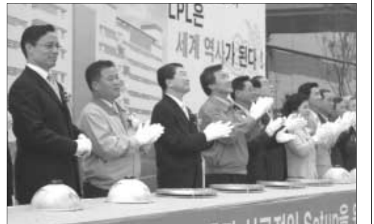
손학규 경기도지사는 지난 7일 오후, 파주 디스플레이 클러스터의 LG.Philips LCD 7세대 LCD 생산 라인에서 진행된 장비 반입식에서 첫번째 장비가 반입되는 것을 기념하며 박수를 치고 있다. (사진 왼쪽부터 LG.Philips LCD 본 위리하디릭사 사장, 변재환 노조위원장, 구본준 부회장, 손학규 경기도 지사, 유화선 파주시장, 이재창 국회의원, 김영선 국회의원, 이재훈 산자부 무역투자실장)