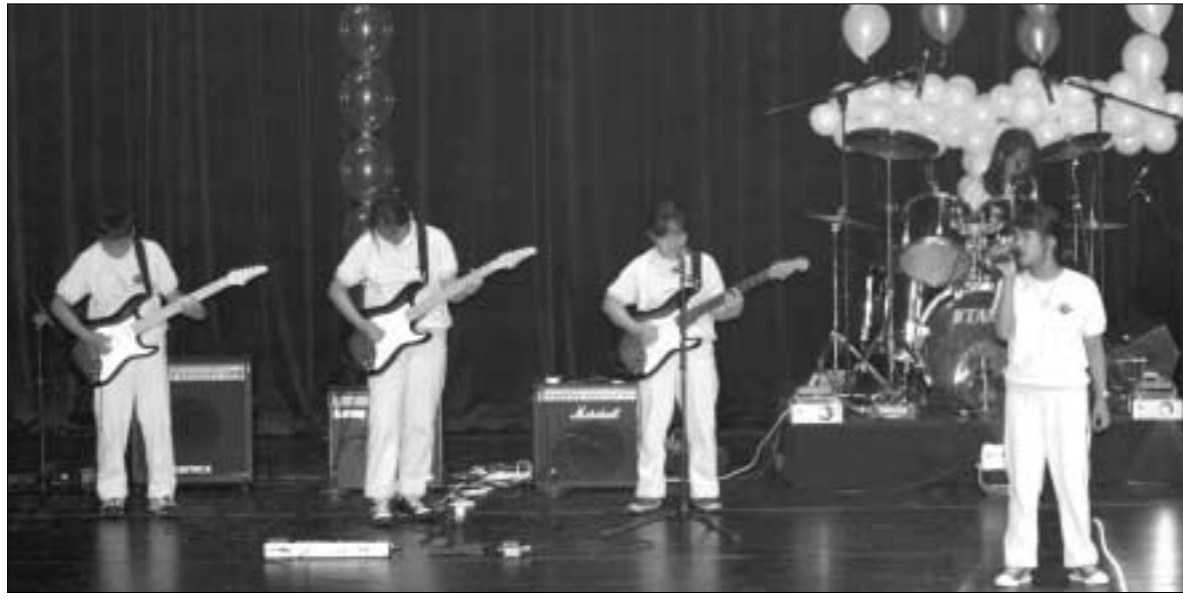
보정초등학교 락밴드 징지는 6명의 학생들이 경연에 참가해 열띤 공연을 펼치고 있다.