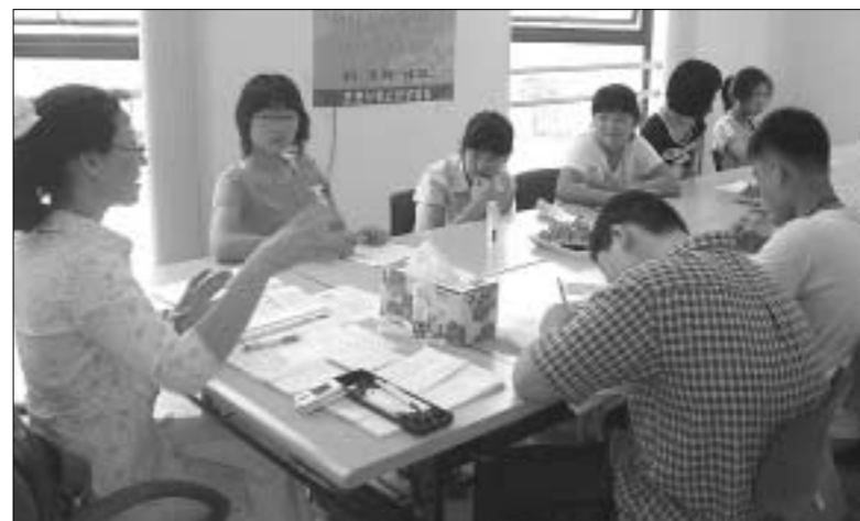
포천시청소년상담센터는 오는 26일부터 8월11일까지 초등학생위향 독서논술교실과 중학생을 위한 집중력 교실을 개강한다.