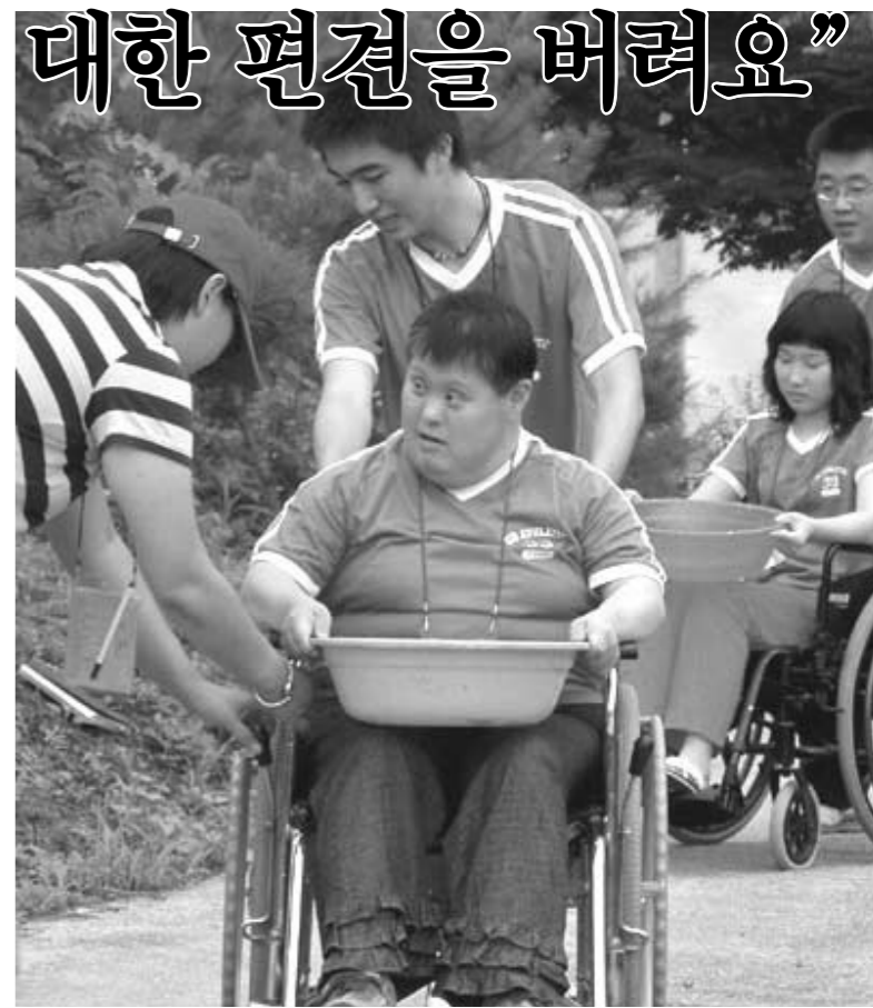
포천시자원봉사센터는 오는 20일부터 22일까지 베어스타운 타워콘도에서 장애우와 함께하는 청소년 자원봉사캠프를 개최한다.

포천시자원봉사센터는 오는 20일부터 22일까지 베어스타운 타워콘도에서 장애우와 함께하는 청소년 자원봉사캠프를 개최한다. 이번 캠프는 청소년 봉사활동을 통해 건강한 문화형성과 봉사의 의미를 찾고, 향후 지속적인 봉사활동이 이루어 질 수 있도록 학생자원봉사단 구성과 지역 내 사회복지시설과 연계해 각종 프로그램을 통해 장애인에 대한 편견을 버리고 자원봉사에 대한 체계적인 교육의 시간이 될 수 있도록 마련된다. 캠프의 참가자는 관내 고등학교 재학생 1학년생을 대상으로 72명과 지적장애인 3명, 정신지체장애인 3명, 시각장애인 2명, 청각장애인 2명 등 총 100여명이 참가하게 된다. 8인 12조로 구성되는 이번 캠프에서는 청소년 자원봉사 기초 및 소양교육을 통해 자원봉사 활동의 의미 자원봉사자의 기본지식에 자원봉사활동 계획 및 실천 지도의 교육과 체험프로그램으로 장애인에 대한 이해 및 장애체험을 실시하게