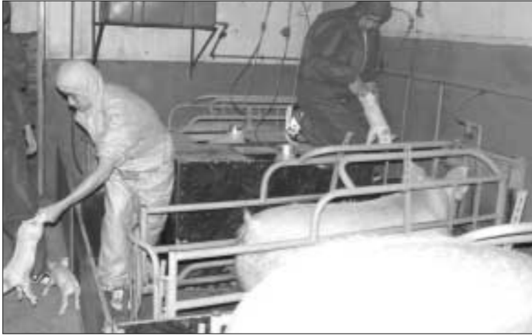
포천종합고등학교 비즈니스 창업동아리 양돈동아리 학생들이 돼지새끼를 받아내고 있다.