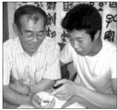
의정부노인복지회관에서는 지난 5월30일부터 매주 월요일 어르신들을 대상으로 한 휴대폰교육을 실시하고 있다.