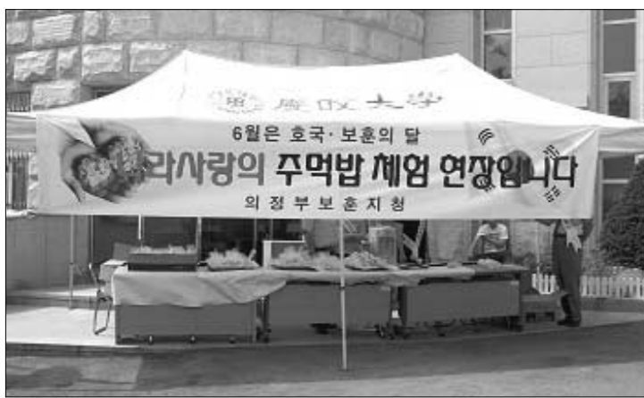
의정부보훈지청 지난 24일 경민학원 기념관에서 나라사랑 주먹밥 시식행사를 가졌다.

의정부보훈지청(지청장 오기택)은 지난 24일 경민학원 기념관에서 나라사랑 주먹밥 체험시식 행사를 가졌다. 이날 행사는 6.25전쟁 발발 55