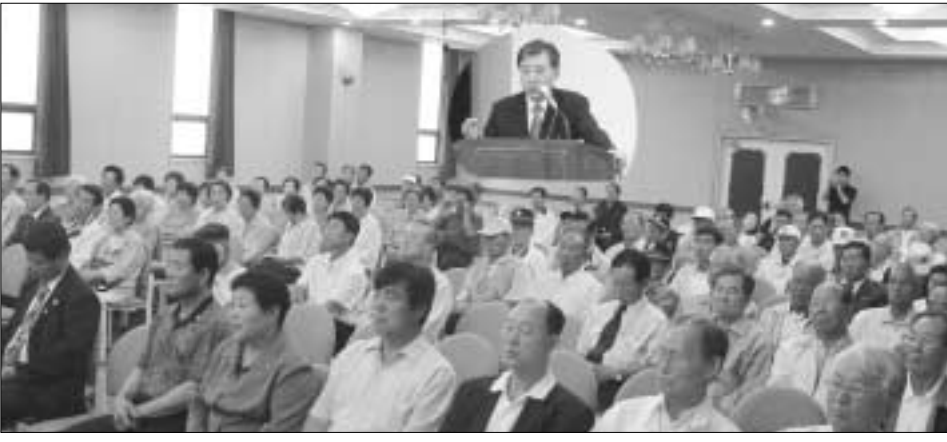
포천시는 지난 18일 여성회관에서 상이군경회 포천시지회 등 7개 보훈단체 140여명의 회원들을 초청한 가운데 위로와 격려의 자리를 마련했다.

포천시는 호국보훈의 달 6월을 맞아 지난 18일 여성회관에서 상이군경회 포천시지회 등 7개 보훈단체 140여명의 회원들을 초청한 가운데 위로와 격려의 자리를 마련했다. 이날 행사에서 박윤국 포천시장은 국가를 위해 헌신하신 보훈가족의 예우와 지원에 더욱 힘쓰겠다고 밝히고, 국가와 민족을 위한 보훈가족들의 헌신과 열정이 포천시 발전의 밑거름이 될 수 있도록 시정에도 더욱 많은 관심을 기울여달라 당부했다. 이번 간담회에는 지역 상이군경회와 전