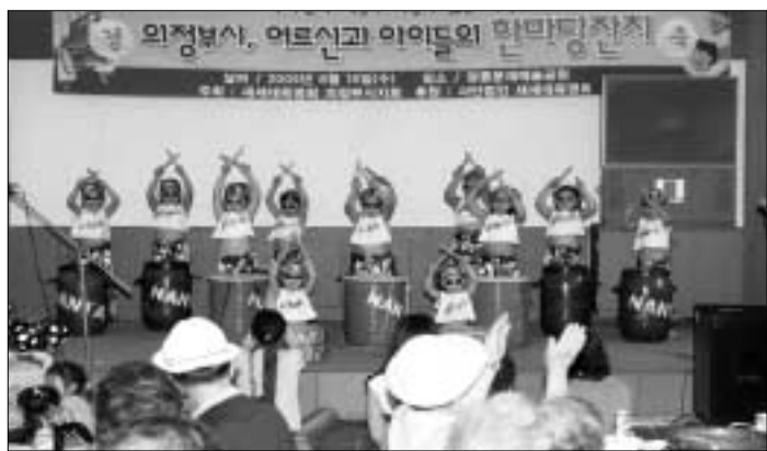
새세대유영회 의정부지회는 지난 15일 포천시 광릉분재예술공원에서 관내 어르신 200여명을 초청하여 한마당 잔치를 개최했다.