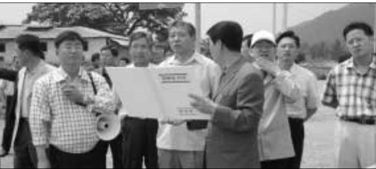
이석우 행정2부지사는 지난 17일 연천군을 방문 임진강유역 침수위험지구 3개소에 대하여 현지 확인을 실시했다.

이석우 행정2부지사는 지난 17일 연천군을 방문 임진강유역 침수위험지구 3개소에 대하여 현지확인 가졌다.