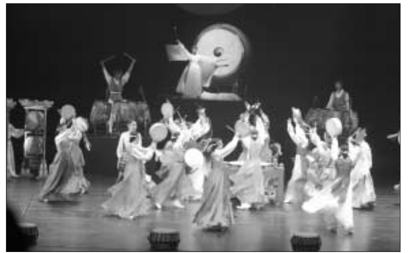
의정부문화원 상설 문화축제가 7월 30일까지 문화원 야외무대에서 개최된다.

이 자리에 참석한 시민들은 어깨를 들썩이며 한바탕 신명나는 여름 밤 무대를 즐겼다는 평가를 받았다.