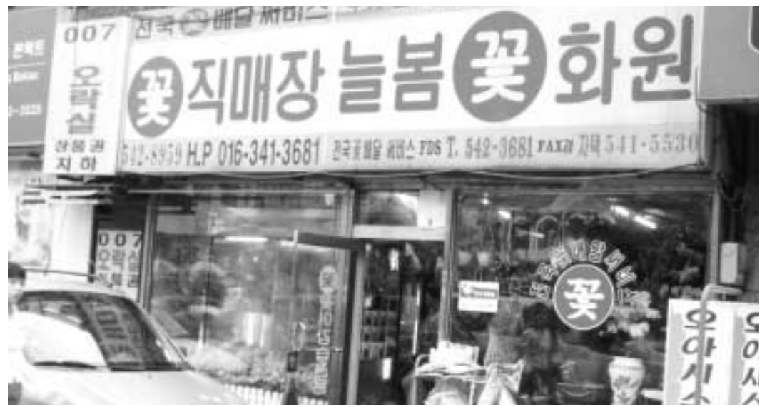
체계화 된 고객관리, 앞서가는 서비스로 이지역을 대표하는 늘봄꽃 직매장.