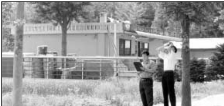
한국전력 포천지점은 지난 1일부터 오는 7월 31일 산업안전강조기간에 전력설비 순시를 실시하고 있다.