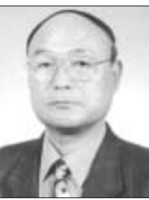
이 중 희 포천시선거관리위원 시인, 본지 자문위원