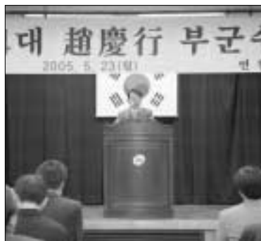
조경행 제14대 연천부군수는 지난 23일 취임식을 갖고 업무에 들어갔다.

연천군은 지난 23일 군청 대회의실에서 실과소위원장, 읍면장을 비롯한 분청 전직원이 참석한 가운데 조경행 제14대 연천 부군수 취임식을 가졌다.