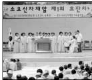
소요산 자재암은 지난 26일 소요산 아외음악당에서 노인 1천200여명이 참석한 가운데 제1회 효잔치를 개최했다.