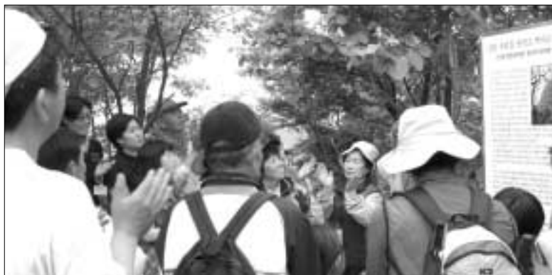
제1회 기산유원지 한마당 축제를 찾은 참가자들이 기산보루성 안내판 제작을 미치고 즐거워하고 있다.

지난 22일 양주시 백석읍 기산리 산소마을에서 개최된 제1회 기산유원지 한마당 축제가 1천5백여명이 행사장을 찾은 가운데 성공리에 축