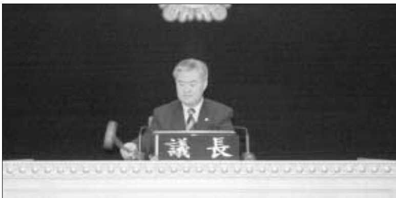
양주시의회 이상원 의장이 제139회 임시회를 진행하고 있다.