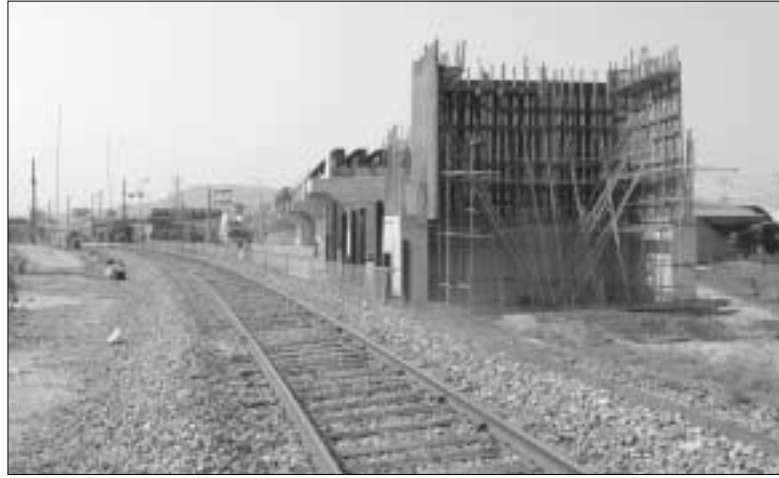
경원선 북선전철 덕정역 구간이 주민의견이 반영된 가운데 교량화로 시설 개선된다.

경원선 전철복선화 사업추진으로 인해 시가지가 동서로 단절될 위기에 처했던 덕정역 토공구간 교량구조물설계변경 요구가 마침내 받아들여져 사업추진에 탄력을 받