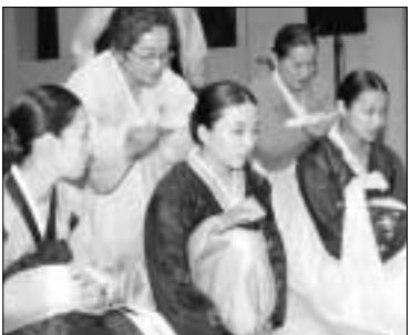
성년의 날을 맞이하는 성년대상자들이 전통 성년의를 차리고 있다.

의정부시(시장 김문원)에서는 5월 셋째 월요일인 지난 16일 성년의 날을 맞이하여 의정부시에 거주하는 성년대상자 4천803명(1985년생)에게 시장명의 축하카드를 발송했다.