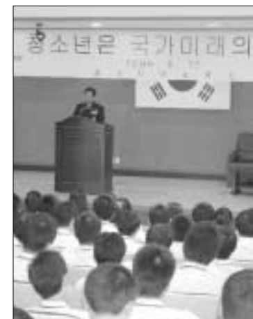
경기지방경찰청 제2청은 지난 17일 의정부공업고등학교에서 교직원과 재학생을 대상으로 학교폭력예방을 위한 특강을 실시했다.

또한 여러분이 선생님과 부모님의 가르침을 받지 않고 민인이 우러러보는 훌륭한 사람이 되겠다는 것은 어불성설이며, 무한 경쟁시대에서 남과 똑같이 먹고, 자고, 놀아서는 더 나은 자신의 발전을 기대할 수 없고 결국은 낙오자가 될 뿐