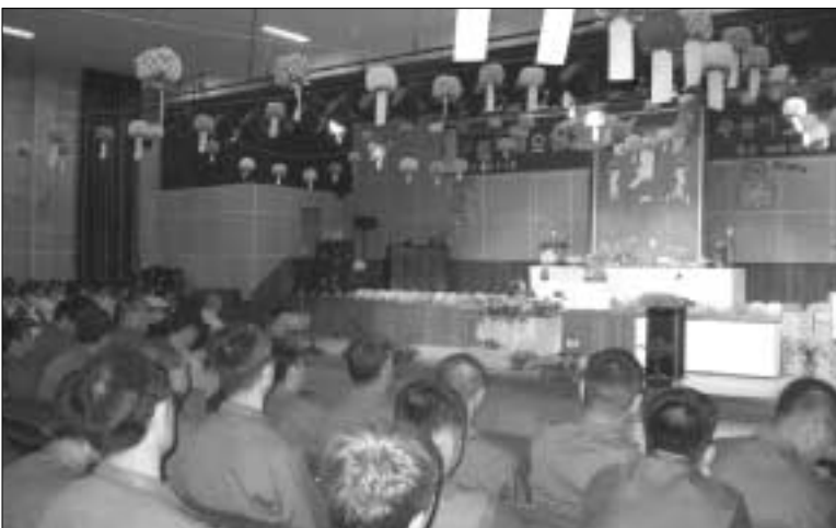
정부 교도소(소장 김건휘)는 지난 11일 불기 2549년 석가탄신일 봉축대법회를 700여명의 수용자와 100여명의 외래 인사들이 참석한 가운데 개최했다.

의정부 교도소(소장 김건휘)는 지난 11일 불기 2549년 석가탄신일 봉축대법회를 700여명의 수용자와 100여명의 외래 인사들이 참석한 가운데 개최했다. 수용시설 안에서도 연등을 만들며 불심을 아로새긴 수용자들은 지난날의 잘못을 부처님의 진리로