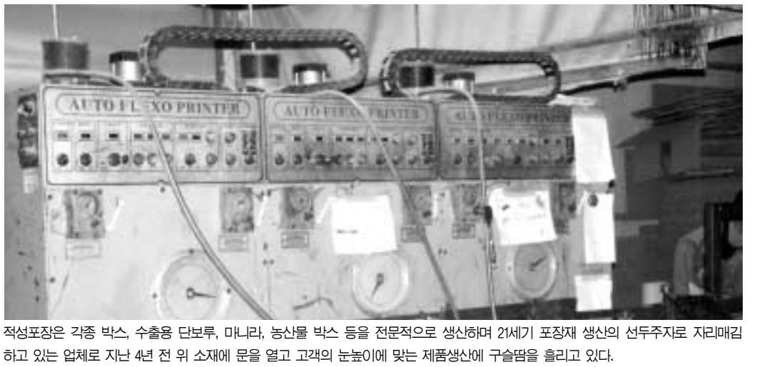
적성포장은 각종 박스, 수출용 단보루, 마니라, 농산물 박스 등을 전문적으로 생산하며 21세기 포장재 생산의 선두주자로 자리매김하고 있는 업체로 지난 4년 전 위 소재에 문을 열고 고객의 눈높이에 맞는 제품생산에 구슬땀을 흘리고 있다.

며 양질의 제품을 공급하고 있다. 이 대표는 또 한 “헌번 고객은 영원한 고객이다”라는 평소 소신에 협력업체 온누리과 수시로 친목과 우의를 다지고 있으며 예전에 자전거를 타고 박스를 배달해줄 때 맺은 인연을 지금까지 이어가는 토종 경영인으로 인정받고 있다. 이 대표는 사업초기 당시 초심을 잃지 않고 고객과 함께 성장하기 위해 첨단화된 기기와 인쇄기를 도입해 양질의 제품공급으로 협력업체와 상생의 길을 걷고 있다. 또한 재료의 선택에서부터 제작, 관리비용까지 고객의 이윤추구를 위해 고객의 입장에서 한번 더 생각해 원가절감에 최선의 노력을 기울이고 있다. 이처럼 고객이 원하는 제품이 신속하고 정확한 납기로 주문 생산되는 제품은 협력업체에게 원가절감 효과와 더불어 믿음까지 제공하고 있다. 현재 적성포장은 애로라지 양질의 제품만을 생산해 협력업체에게 공급하는 보람으로 실속 있고 내실 있는 경영을 펴하며 미래를 준비하고 있다. 또한 적성포장은 고객이 주문한 제품에 감동까지 서비스하며 실속 있는 저렴한 가격으로 고객들의 이윤창출에 일조하며 미래지향형 기업으로 발돋움하고 있다. 문의)031-8781-2 정병갑 기자 jpk61@paran.com