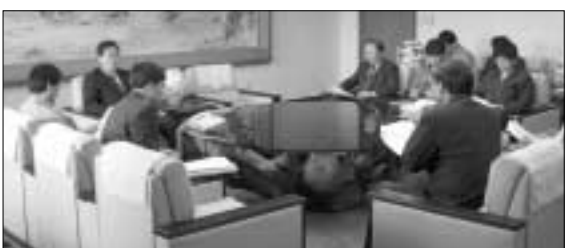
포천시는 축산업등록제를 효율적으로 추진하기 위해 축산업등록제 관련 무허가축사 처리대책 관계자 회의를 개최했다.

포천시는 올해 축산업등록제를 효율적으로 추진하기 위해 지난 10일 시청 브리핑룸에서 지역 낙농가대표와 관계공무원 등 15명이 참석한 가운데 축산업등록