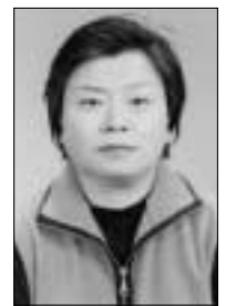
남 만 우 일동초등학교 어머니회장 포천신문 주부मंत्री기자단 일동지부장

메마르던 대지에 단비가 뿌려주어 초록의 마음은 풍성하여 지천만 내일이 바자회 날인데 계속 비가 오면 어쩌나 하는 걱정에 밤잠을 설치며 아침하늘을 보니 너무나 맑게 화창한 하늘이 우리를 반겨 주었습니다.