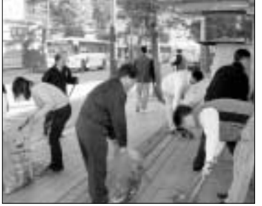
깨끗한 포천 가꾸기'를 위한 조기 대청소.