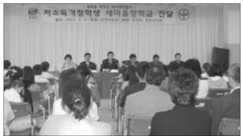
새마을운동포천시지회 지난 2일 포천시청 대회의실에서 관내 초등학교 결식아동 31명을 대상으로 장학금을 지원하는 행사를 마련했다.