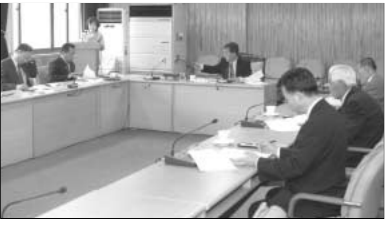
포천시 지난 6일 시청 소회의실에서 향토장학기금 운용심의위원회를 열고 장학금 수혜대상자를 선정했다.

생에 대해 장학금을 전년 대비 각각 20%와 10% 인상해 전달하기로 했으며 이에 따라 고등학생은 60만원, 대학생은 220만원의 장학금을 받게 됐다. 포천시는 인재양성과 애환심 고취를 위해 조례에 있는 소정의 자격기준에 따라 매년 대상자를 선정, 향토장학금을 지급해오고 있다. 지역배 기자 94spice@hanmail.net