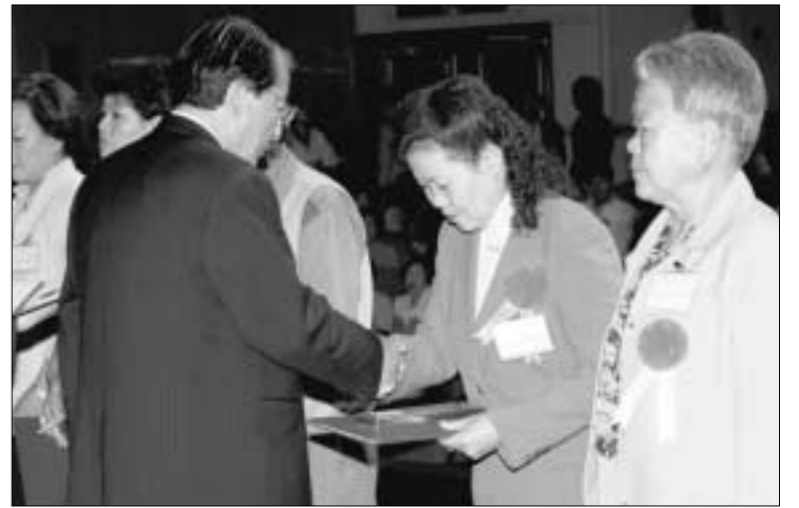
의정부시는 지난 6일 제33회 어버이날을 맞아 의정부예술의전당 대공연장에서 노인 1천여 명을 초청한 가운데 기념식을 개최했다.

의정부시는 제33회 어버이날을 맞아 자칫 퇴색되어 가는 효에 대한 개념과 가치관을 새롭게 조명하기 위해 지난 6일 김문원 의정부시장을 비롯한 내빈 및 노인들 1천여 명이 참석한 가운데 의정부예술의전당 대공연장에서 기념식을 개최했다. 기념식 행사는 제1부 기념식과 제2부 축하공연 순으로 진행되었으며, 제1부 기념식에서는 남다른 정성과 노력으로 효를 실천하고 있는 효행자 및 경로효친 사상 앙양과 노인복지증진에 기여한 노인복지 기자 등을 발굴하여 포상 하였고, 제2부 축하공연에서는 공립어린이집 원아들이 출연하여 재롱잔치를 벌이자 노인들의 얼굴에 웃음이 떠나지 않았다. 김문원 시장은 기념식 축사를 통하여 최근 사회가 급속히 발전되어 물질이 풍요로워 지면서 우리의 전통미풍양속인 경로효친 사