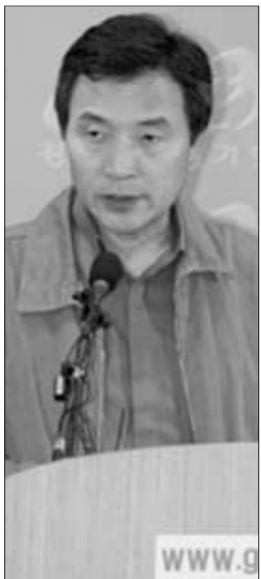
지난 8일 경기도청 브리핑룸에서 기자회견을 하고 있는 손학규 경기도지사.