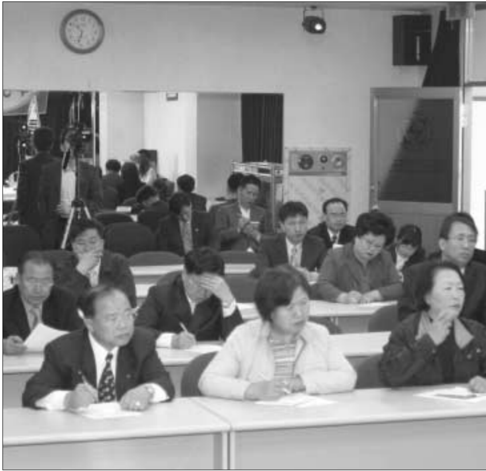
4 · 30국회의원 재선거 후보초청 토론회에 참석한 방청객들이 각 후보들의 주제별 토론회를 경청하고 있다.