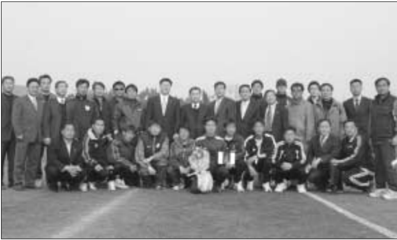
지난 1일 경기도협회장기 초·중·고 축구대의 폐회식에 참석한 대한축구협회의 경기도축구협회장과 주최하고 포천시체육회와 포천시축구협회 관계자들이 한자리에 섰다.

대한축구협회와 경기도축구협회가 주최하고 포천시체육회와 포천시축구협회가 주관한 경기도협회장기 초·중·고 축구대회가 지난 달 22일부터 4월 1일까지 11일간 포천종합운동장 등 포천지역 5개 운동장에 펼쳐졌다. 이번 대회는 ▶제34회 도협회장기 유소년 축구대회 겸 동원컵 1차 리그전 ▶제43회 도협회장기 중등부 겸 나이기 선발전 ▶제33회 도협회장기 고등부 축구대회 겸 제86회 전국체전 1차 선발전 등을 겸해 개최되었으며 ▶초등학교 42개 ▶중학교 30개 ▶고등학교 14개 등 모두 86개 팀 2천500여명의 선수와 임원이 참가한 가운데 진행됐다. 포천종합운동장과 영북하수종말처리장 운동장에서는 초등부가, 포천종합운동장, 동남고, 일동중고, 포천중학교에서는 중등부와 고등부가 경기를 치른 가운데 경기결과를 종합해 보면 다음과 같다. ▶우승 안양초, 풍생중, 동두천 정보산업고(이하 동두천정산고) ▶준우승 세류초, 부곡중, 안양공