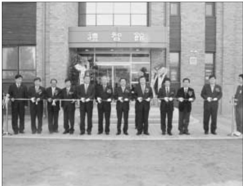
연천군은 지난 24일 순학규 경기도지사과 김규배 연천군수 및 학부모 학생 등 1천100여명의 내외빈이 참석한 가운데, 전곡고등학교 체육관에서 기숙사 개관식을 가졌다.

연천군은 지난 24일 순학규 경기도지사과 김규배 연천군수 및 학부모 학생 등 1천100여명의 내외빈이 참석한 가운데, 전곡고등학교 체육관에서 기숙사 개관식을 가졌다. 연천군은 지난 24일 순학규 경기도지사과 김규배 연천군수 및 학부모 학생 등 1천100여명의 내외빈이 참석한 가운데, 전곡고등학교 체육관에서 기숙사 개관식을 가졌다.