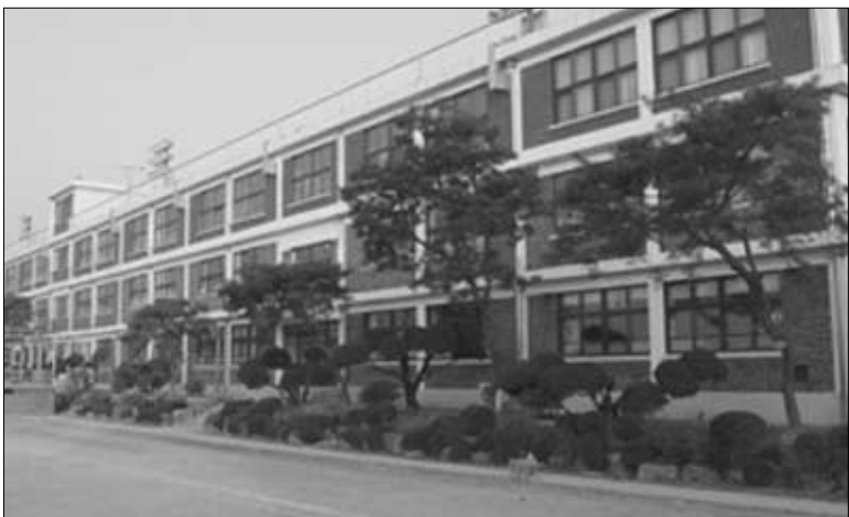
참되고, 슬기롭게 꿈을 키우는 즐거운 학교로 알려진 가산초등학교는 포천시 가산면 마산리 407번지에 위치하고 있다.