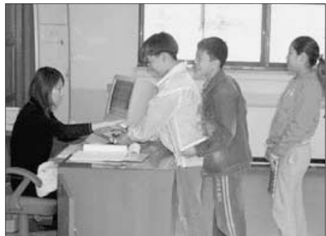
가산초등학교 학생들이 도서실에서 사서교사로부터 도서대출을 받고 있다.