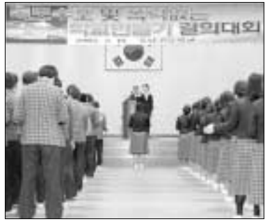
동남고 학생들이 폭력없는 학교를 만들며 '학교폭력 추방' 구호를 외치고 있다.