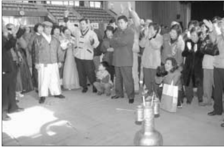
동두천문화원은 지난 23일 시민회관 체육관에서 정월대보름맞이 민속경기대회를 개최했다.

경기북부 각 시·군은 민족고유의 명절인 정월대보름맞이 행사를 통해 시민화합의 다채로운 행사를 통해 시민화합의 마당 잔치를 개최했다.