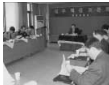
연천경찰서는 지난23일 경찰업무혁신을 위한 토론회를 개최하고 인견을 논의했다.

이는 모든 경찰업무를 신속하고 간소화함으로써 고객(민원)만족도를 높이고, 과거 경찰과는 달리 권위적이고 규제하는 경찰이 아닌 부