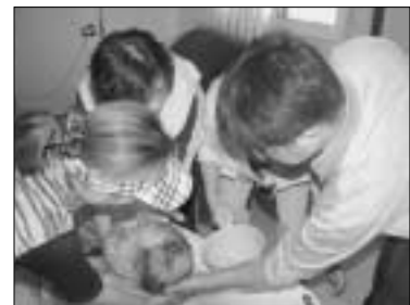
연천군은 지난 24일 장애인 및 거동불편 노인 200여명을 대상으로 목욕사업을 실시했다.

연천군은 지난 24일 장애인회관 내 목욕장에서 장애인 및 거동불편 노인 200여명을 대상으로 목욕사업을 실시했다.