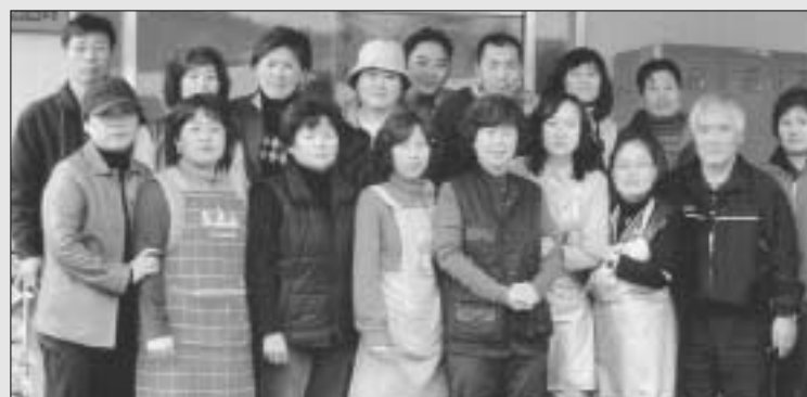
지난해 사회봉사 사업인 정신보건센터에 김장을 담겨주고, 쌀을 전달한 동두천시 로타리클럽.

"시민들이 감내한 50여년 세월의 어려움과 고통, 시민들이 국가안보를 위해 미군에게 막대한 공여지를 제공하면서 사유재산권이 제한되고 토지이용이 규제되는 등 지역주민의 피해는 말할 수 없을 정도로 커 왔던 게 현실입니다. 따라서 국화와 정부차원의 보상이 절실한 실정이고 무상양