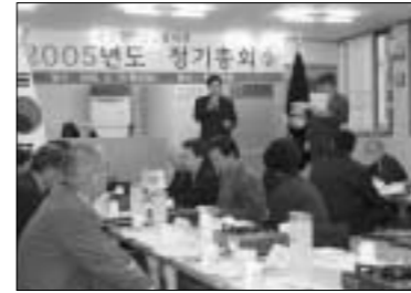
연천군 기업인협의회는 정기총회에서 2004년도 결산보고 및 임원개선에 관한 안건을 처리했다.

“어려운 경제여건 속에서도 협의회 발전에 힘쓰신 전임 회장 및 임원들의 노고에 깊이 감사드리며 앞으로 지역발전에 기여할 수 있는 기업인협의회가 될 수 있도록 노력해 나가겠다”고 밝혔다.