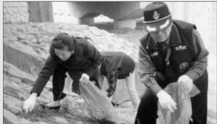
바르게살기운동 동두천시협의회가 지난해 실시한 '신천정화사업'