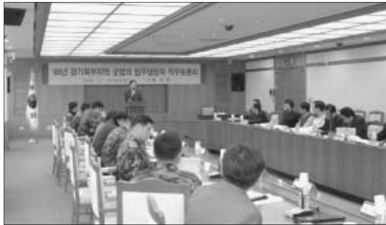
지난 18일 경기도제2청사 상황실에서 개최된 군부대 및 시·군 연합의회 업무담당자간 간담회

군부대 및 시·군 연합의회 업무 담당자간 간담회가 지난 18일 경기 북부 10개 시·군과 28개 부대 군 협의 담당 공무원 및 장교들이 참석한 가운데 경기도제2청사 상황실에서 개최됐다. 군사시설보호법과 군협의 업무에 관한 직무연찬회를 겸한 이날 행사에서 참석자들은 국