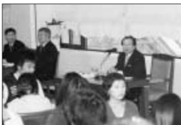
의정부시는 지난 16일 시청 회의실에서 '이르바이트 대학생과의 간담회'를 개최했다.

의정부시는 지난 16일 대학생들에게 겨울방학기간을 활용, 사회를 체험 할 수 있는 기회를 제공하고 시정에 대한 이해를 높이기 위해 '이르바이트 대학생과의 간담회'를 시청 회의실에서 개최했다.