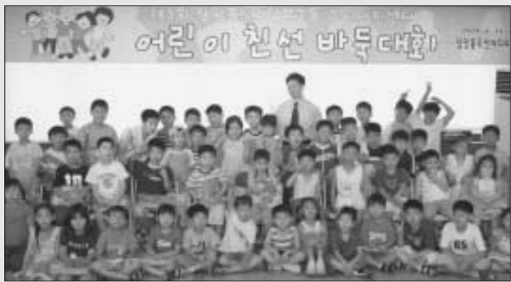
의정부2동 주민자치센터 아동바둑교실과 연2회의 친선교원경기 대회를 통해 실력향상을 꾀하고 있는 장암동 주민자치센터 아동바둑교실.