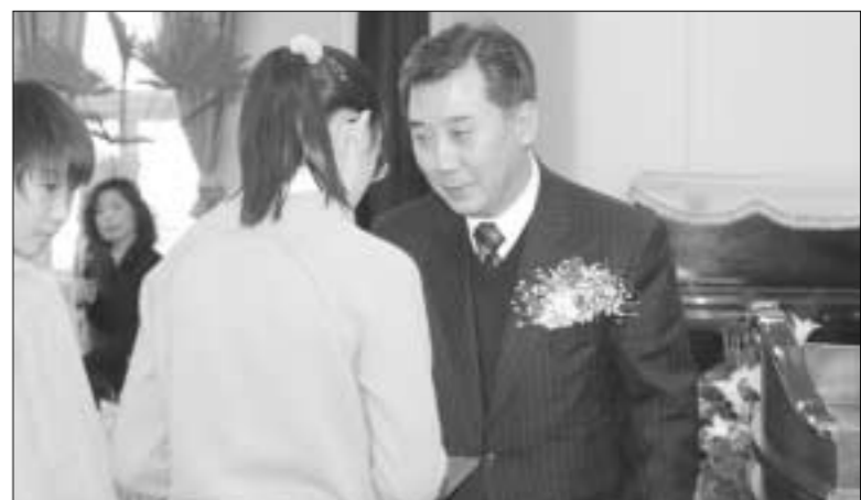
지난 17일 박운국 포천시(장)이 송우초등학교 졸업식에서 우수학생들에게 표창장을 수여하고 있다.