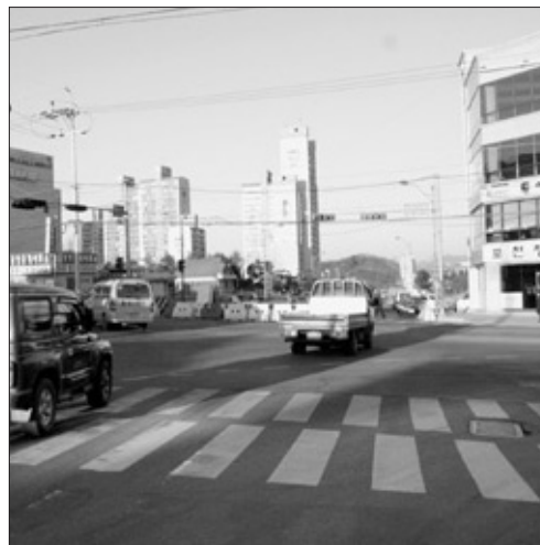
보건소사거리에서 불법으로 도로 공사구간에 진입하는 차량들.

최근 포천시 신읍동 보건소사거리에서는 빈번히 발생하는 교통사고로 인해 운전자들과 주민들을 위한 대책미련이 시급한 것으로 나타났다.