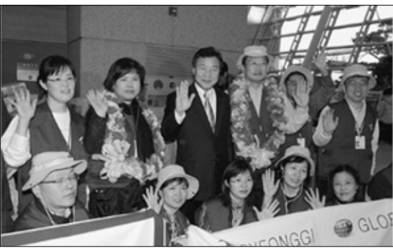
경기도와 글로벌케어는 지난 5일 인도네시아 수마트라섬 주변에 발생한 지진해일로 인한 피해지역 주민을 지원하기 위한 긴급의료 및 방역지원 단을 파견했다.

앞으로도 경기북부지역의 열악한 지역여건 개선을 위하여 지속적으로 재정지원을 확대할 것으로 보여진다. 백성주 기자 paek1031@nate.com