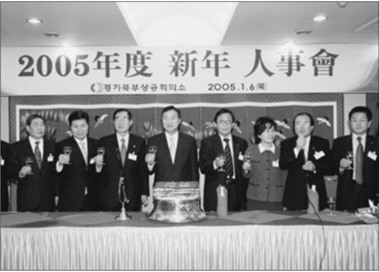
손학규 경기도지사는 지난 6일 김문원 의정부시장을 비롯한 각급 기관단체장 등 300여명이 참석한 가운데 경기북부상공회의소에서 개최된 '경기북부지역 신년인사회'에 참석했다.

손학규 경기도지사가 상대적으로 소외받고 있는 경기북부지역에 대한 남다른 관심과 애정을 보이고 있다. 지난 2004년에 북부 지역을 54일간 방문했는데, 이는 첨단 기술 보유 외국기업 유치에 대한 해외출장 기간을 제외하면 5일에 한번 간격